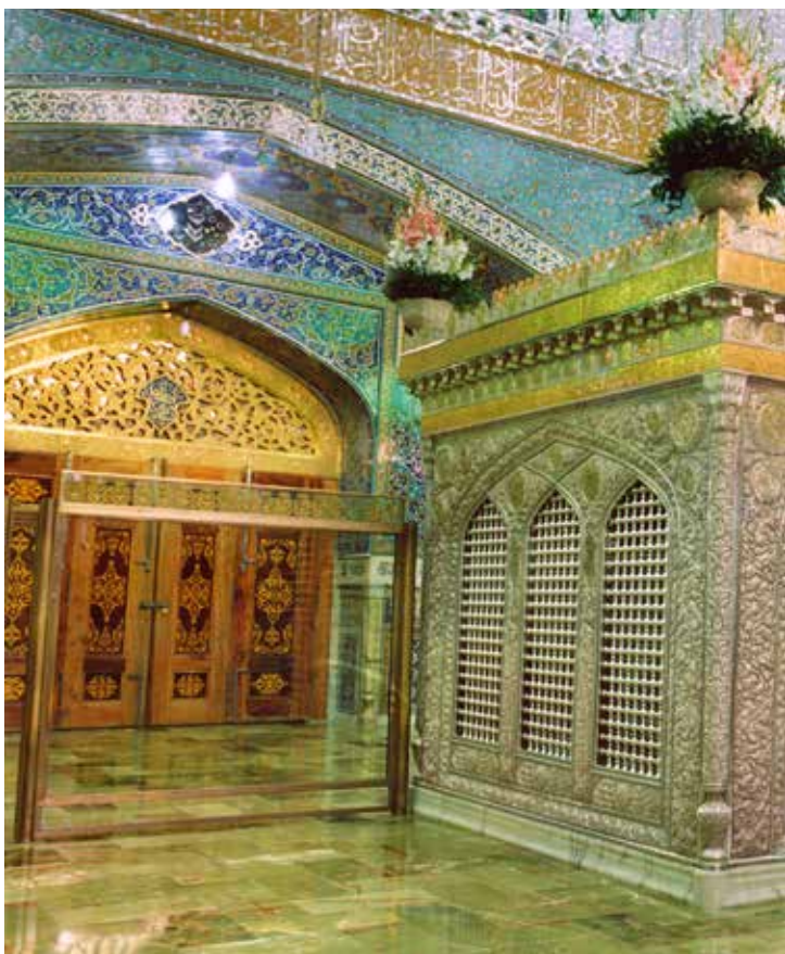
Santuario dell'Imam Reza - Mashad