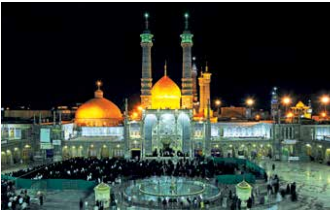
Santuario di Fatima Masumeh - Qom